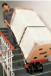
Uittrekbaar: Een hoog transportgoed heeft op de uitgetrokken grepen een veilig steunvlak.