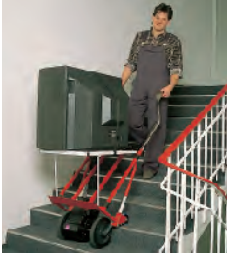
Horizontaal: Met het platform (toebehoren) kunnen lasten tot 130 kilogram ook horizontaal getransporteerd worden.