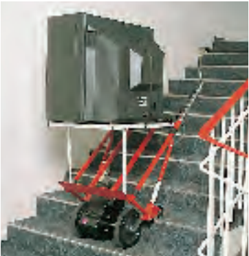
Tussenstop: Veilig stilzetten op de trap is op elk ogenblik mogelijk.

De A 131 is de klassieker van de CargoMaster trapsystemen. Met een solide basisuitrusting en veelvoudige uitbreidingsmogelijkheden bewijst hij sinds jaren zijn betrouwbaarheid in ambacht, handel en industrie. Lasten tot 130 kilogram transporteert het betrouwbare trapsysteem met de elektrische aandrijving van 12 Volt zonder probleem. Met zijn hulp is het mogelijk vaatwassers, wasmachines of droogkasten veilig, snel en zonder moeite te transporteren. Bestanddelen van de basisuitrusting: Sjortouwen die het transportgoed bijkomend beveiligen, uittrekbare grepen, automatische remmen en een laadtoestel. Dankzij een opzetbaar platform (toebehoren) kunnen elektronische toestellen zoals tv-toestellen en kopieermachines ook horizontaal getransporteerd worden.