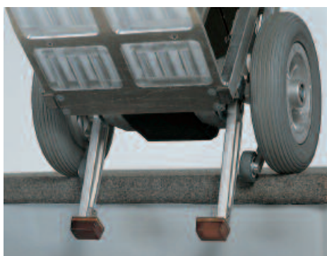
automatique: des freins de sécurité arrêtent le Cargo Master en bord de marche

L'acquisition d'un Cargo Master est un investissement rentable dès les premières utilisations.