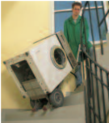
maniabile: les escaliers étroits ou en colimaçon ne sont généralement plus un obstacle

charge maximum: 140 Kg vitesse de montée: réglable de 8 à 30 marches/minutes autonomie: 15 à 30 étages par rechargement batterie (en fonction du poids de la charge)