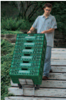
utilisation à l'extérieur: même en plein air le C141 Vario est votre fidèle compagnon

Avantages du Cargo Master C141 Vario: simplicité d'utilisation faible poids propre (20,5 kg pack batterie non compris) encombrement réduit (106 x 45 x 30 cm) poignées réglables en hauteur et en inclinaison.