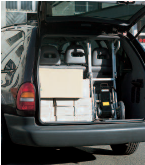
compact: replié il se transporte dans votre véhicule, même encombré