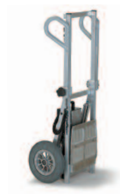
C 141 Vario