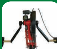
Manivelle en V