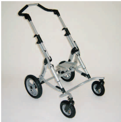
roues avant pivotantes