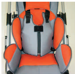
veste de maintien