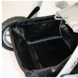
sac fourre tout