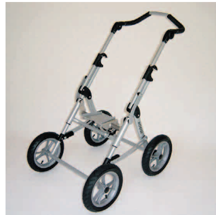
roues avant fixes