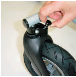
blocage des roues