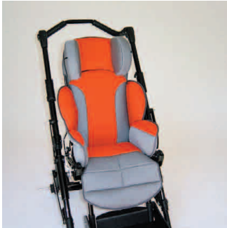
châssis noir coussin rouge/gris