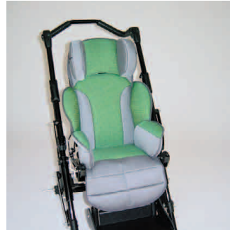
châssis noir coussin vert/gris