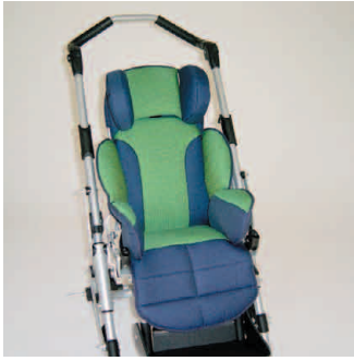
châssis gris métallisé coussin vert/bleu