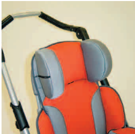
pelote de tête