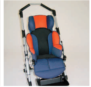
châssis gris métallisé coussin rouge/bleu + filet noir