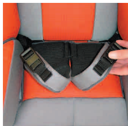
c einture d'abduction