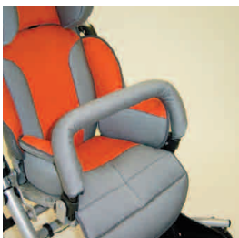
barre de protection