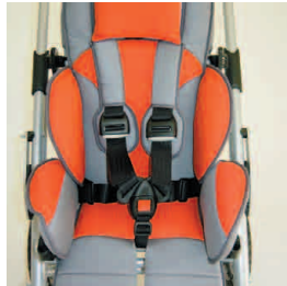
ceinture 5 points