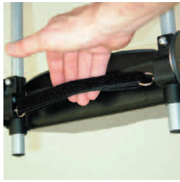
arrêt repose pied