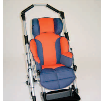
châssis gris métallisé coussin rouge/bleu