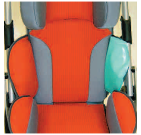
Airflex coussin latéral