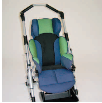
châssis gris métallisé coussin vert/bleu +filet noir