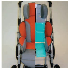
Airflex Kid système