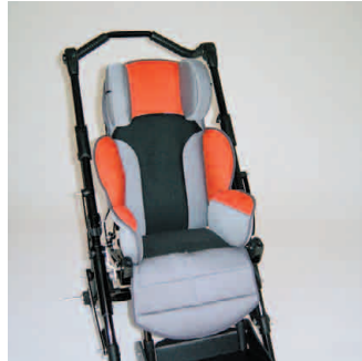
châssis noir coussin rouge/gris +filet noir