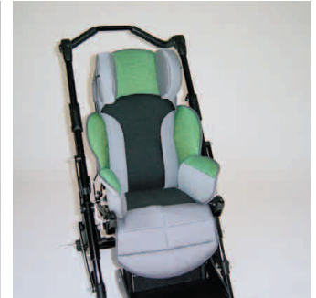
châssis noir coussin vert/gris +filet noir