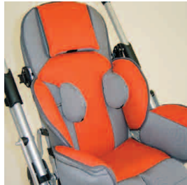
pelote de thorax