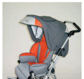
capote + protection pluie