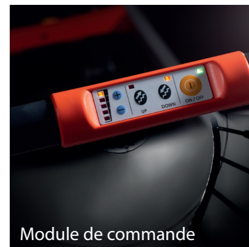
Module de commande

Le C120 est livré avec un chargeur de batterie et une sangle ajustable en hauteur.