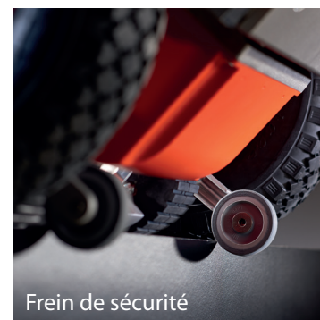
Frein de sécurité