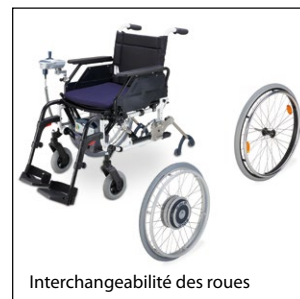
Interchangeabilité des roues