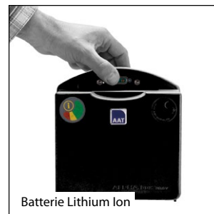
Batterie Lithium Ion

Equipé de la batterie Lithium-Ion (4,2 kg), le SOLO a une autonomie jusqu'à 35 km.