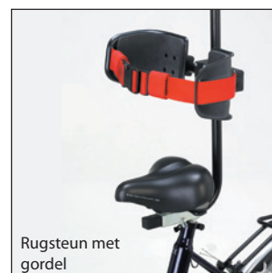
Rugsteun met gordel