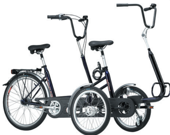
Copilot 3/24 met afhaakbaar voorwiel en kader