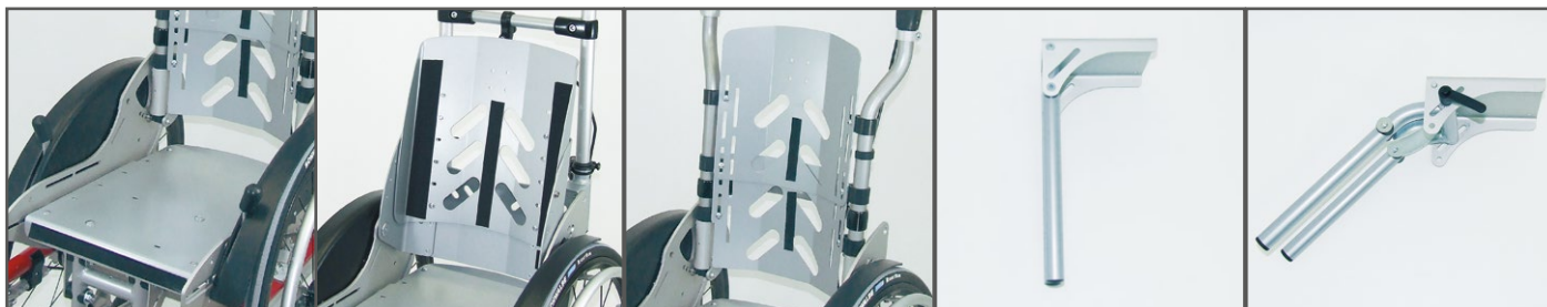
Zitting Rugleuning in de lengte regelbaar en kantelbaar Gevormde rugleuning Stut voetsteun 90° Stut voetsteun die schuin kan gezet worden