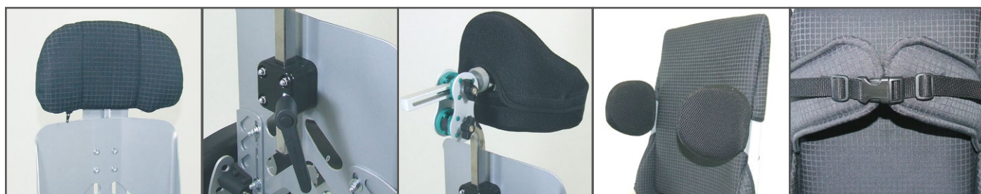
Standaard hoofdsteen Universele hoofdsteen drager Hoofdsteen met neksteun Borstschotten Borst-schouderjasje