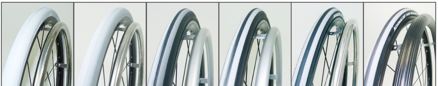
Wiel met massieve band 20", 22", 24"