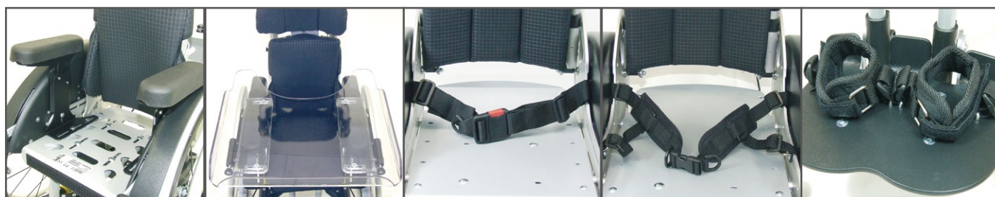
Armlenningen Therapietafel Buikgordel Heupgordel Enkelbandjes