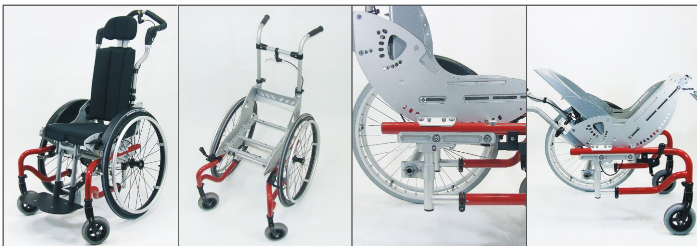
SWINGBO Plus met accessoires