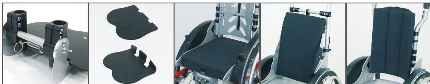
Vergrendelbare voetsteun • Voetsteun • Voetsteun met hielstop Zitkussen Rugkussen voor in de lengte regelbare en kantelbare rugleuning Rugkussen voor gevormde rugleuning